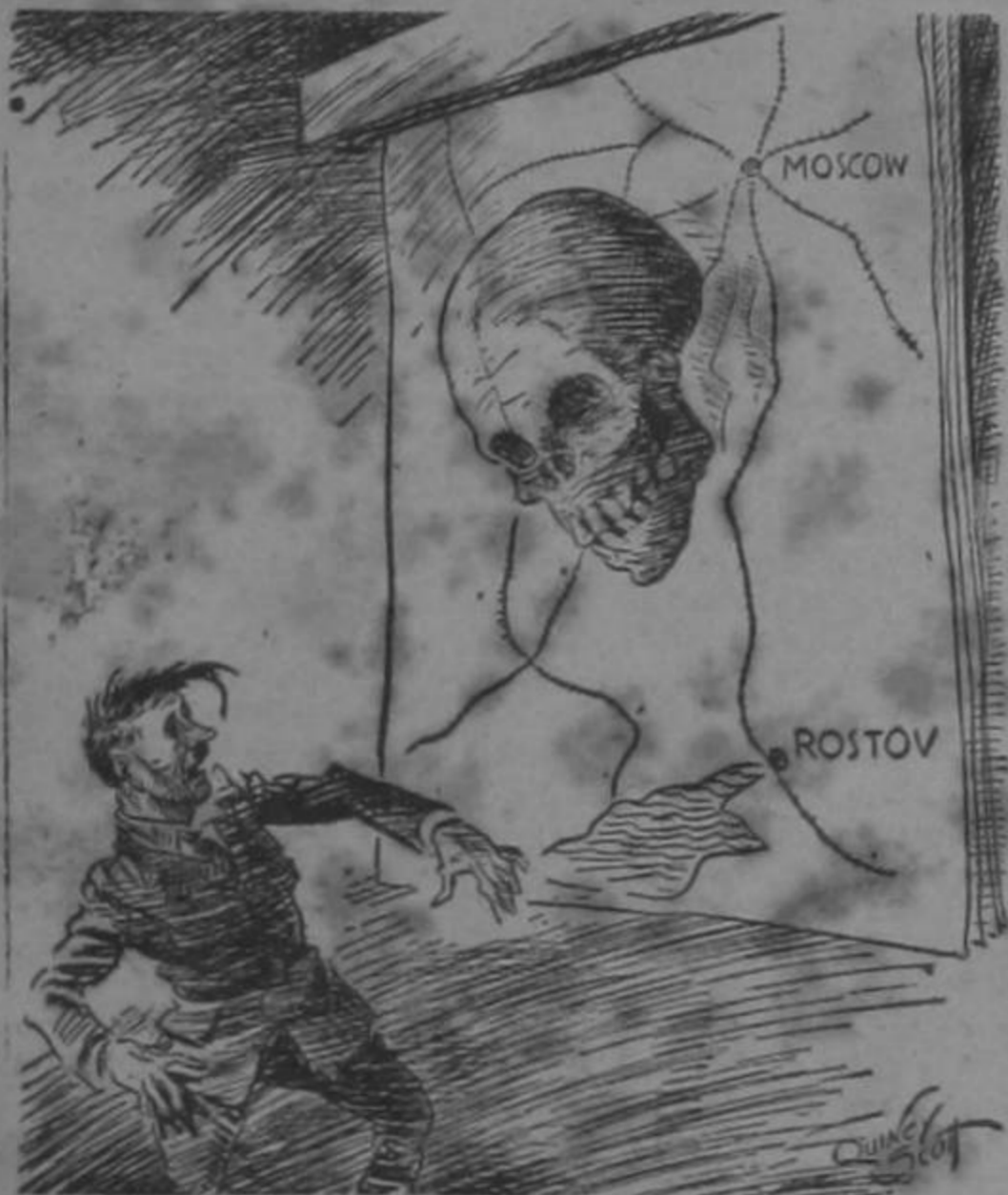
El mapa del fuehrer