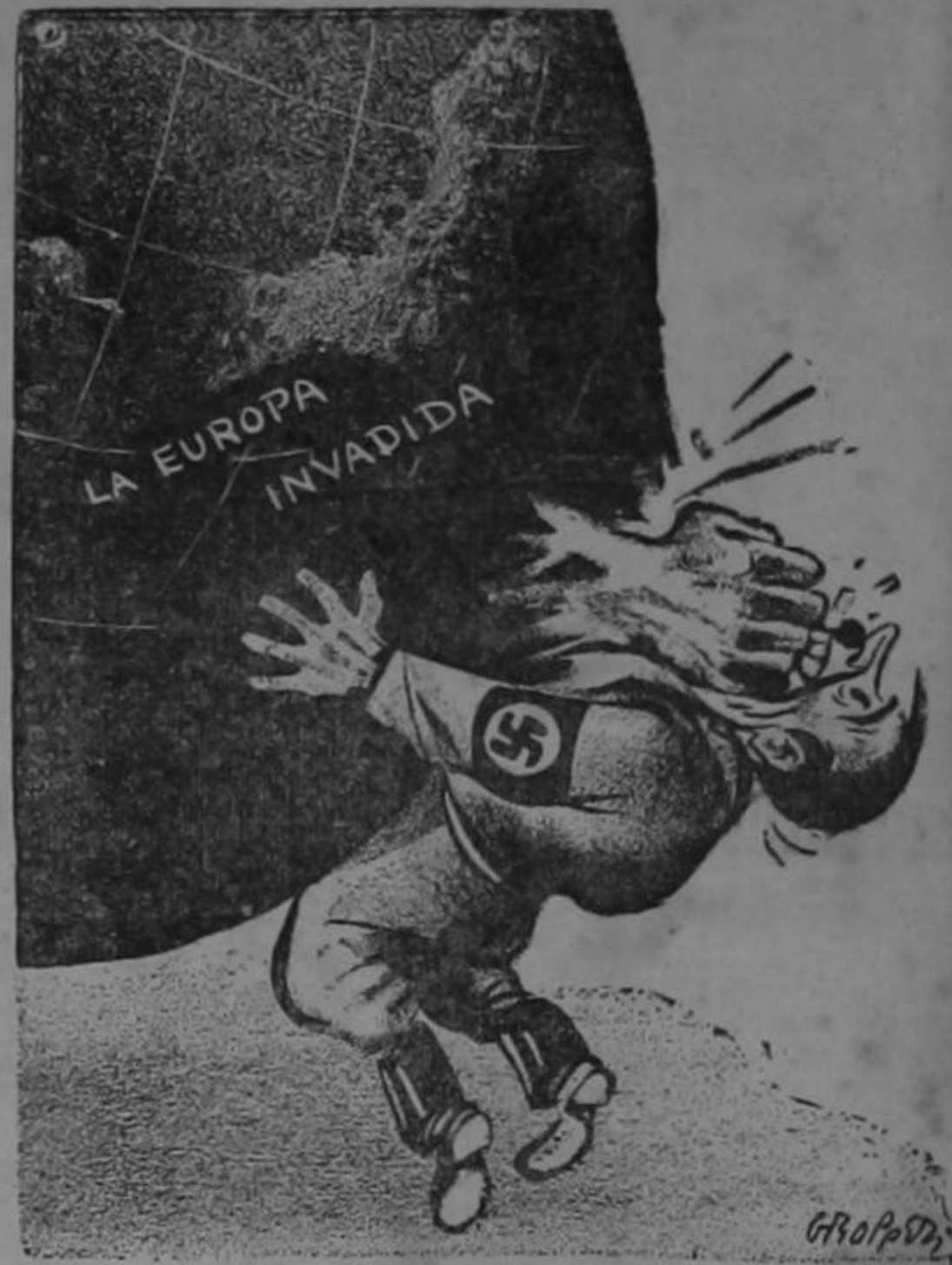
El tiro le salió por la culata...