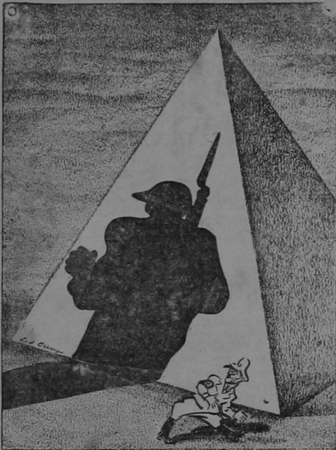
La sombra se va extendiendo cada vez más en Egipto...