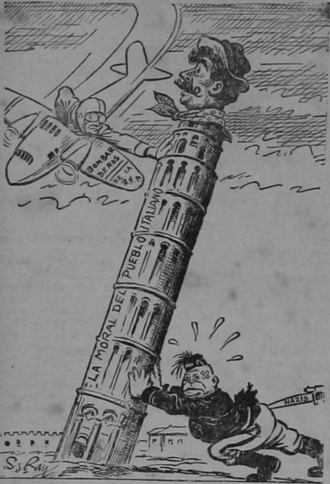
La Torre Inclinada de Italia...