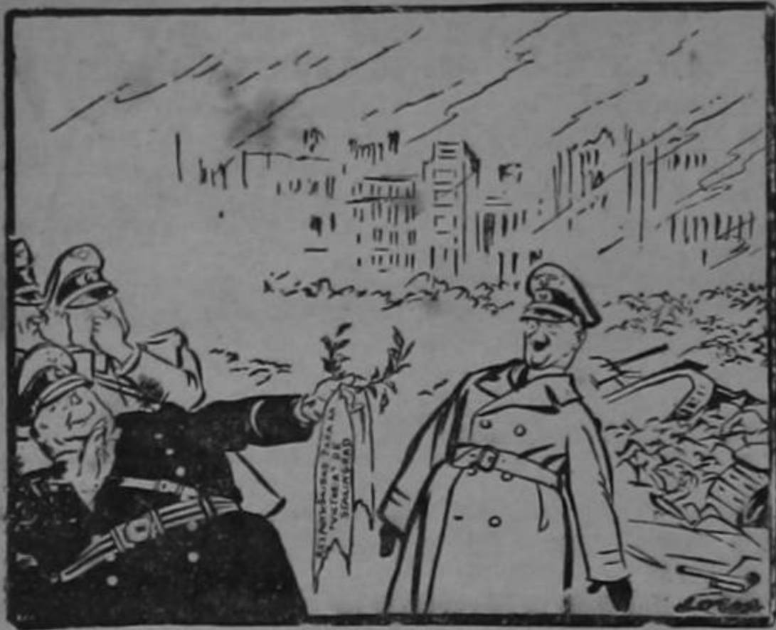
"A ti, querido jefe, te pertenece..."