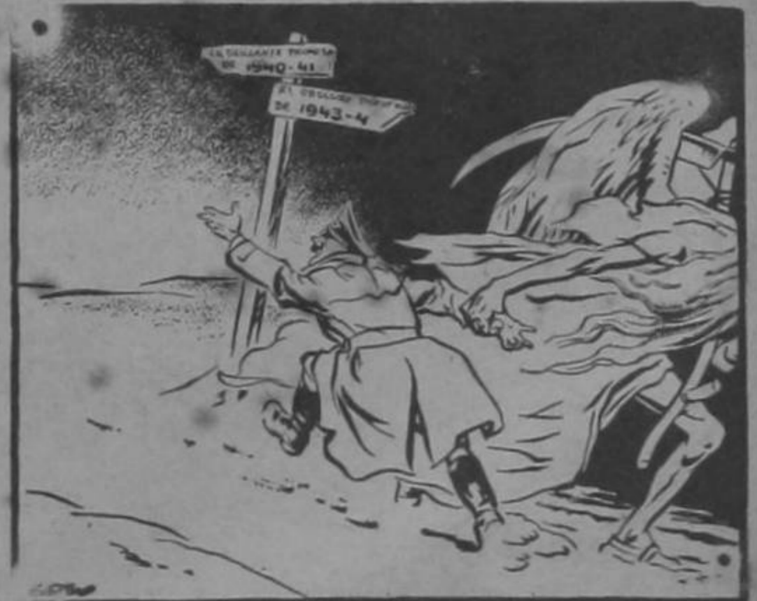
Cuánto diera por volver atrás!