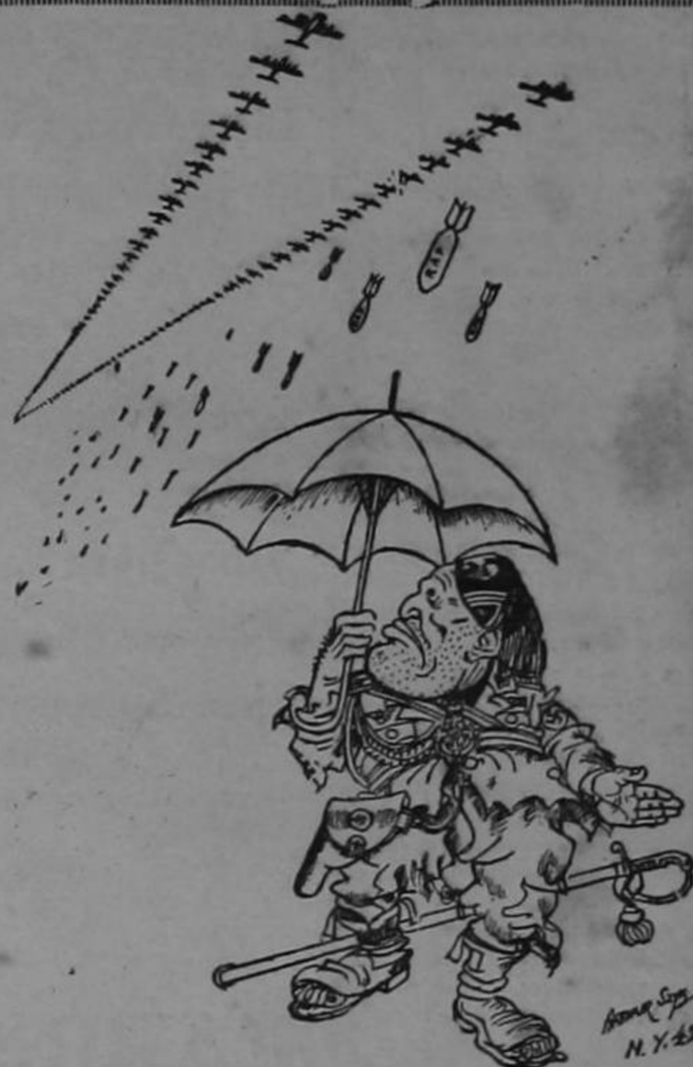
Está lloviendo en Italia...

se, a mí también me va a cortar el rabo.