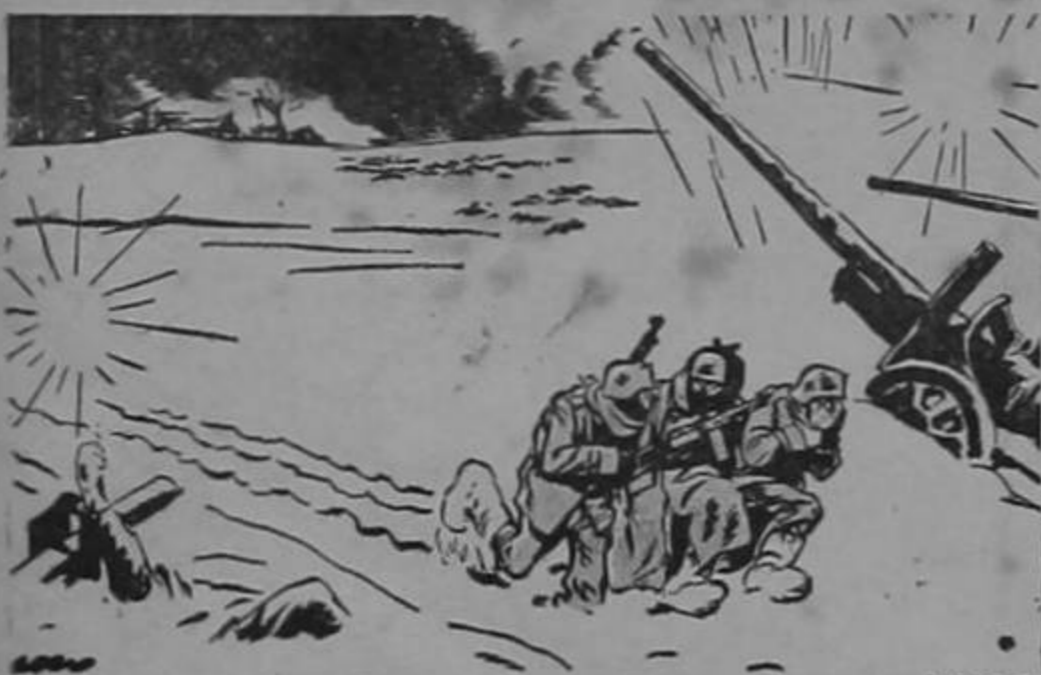
Soldado alemán: "No hemos visto esto antes...?"

Nos regocija sobriamente dar esta noticia de inconfundible matiz patriótico.