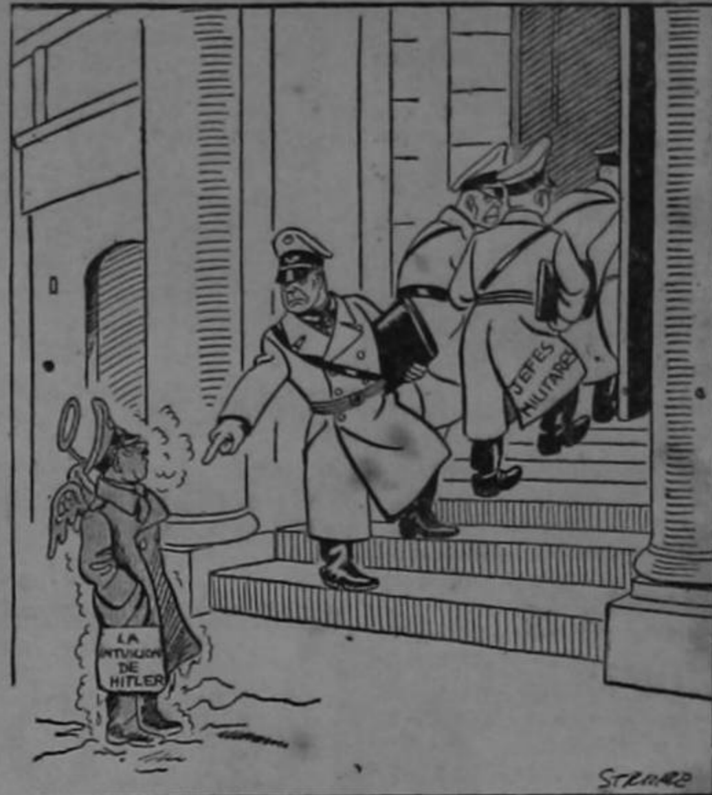
"Tú te quedas fuera..."

—Pues vea, mi amigo, no se queje: cuando Rafael Angel regre-